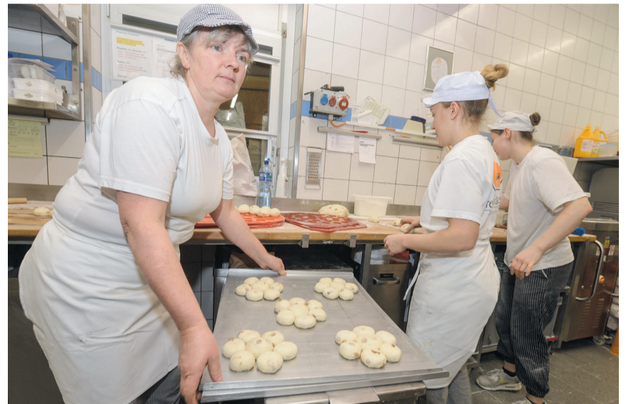
Die 6er-Kuchen sind bereit.