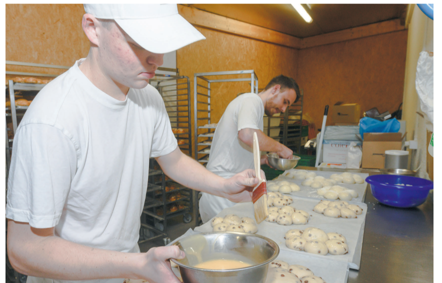
Die Dreikönigskuchen werden vor dem Backen mit Ei bestrichen anschließend werden gehobelte Mandeln, Hagelzucker, Knusperstreusel oder Reibkäse aufgestreut.