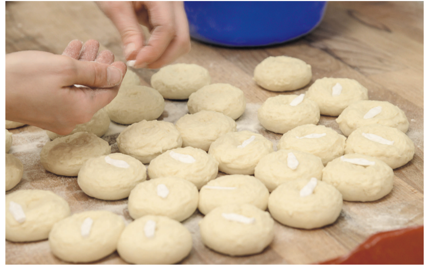
Die Teigkugeln mit dem König werden vorbereitet.

Die Tradition des King Cake in Louisiana und insbesondere in New Orleans wurde von französischen Einwanderern begründet und reicht ins 19. Jahrhundert zurück. Diese Einwanderer brachten sowohl die nordfranzösische