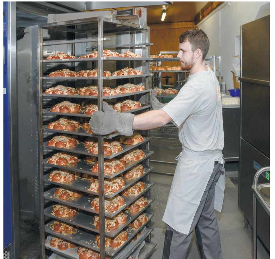
Die Kuchen kommen aus dem Ofen.

Galette des Rois aus Blätterteig mit Marzipanfüllung (heute als French King Cake bekannt) als auch die südfranzösische Variante des bunt dekorierten Hefeteigrings (heute als King Cake bekannt) nach New Orleans, wo beide Versionen bis heute existieren. Gemeinsam haben beide Sorten, dass eine kleine Babyfigur aus Plastik, die das neuge-