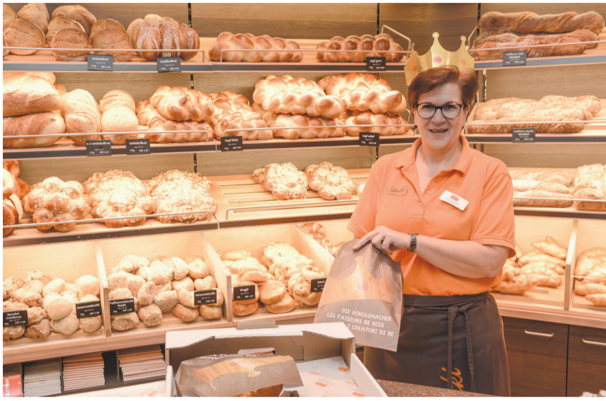
Die Königskuchen warten in der Auslage auf ihre Käufer.

Am Dreikönigstag geht es in der Bäckerei Stucki in Bätterkinden hoch zu und her: rund tausend Dreikönigskuchen werden allein am 6. Januar gebacken. Das traditionelle Gebäck gibt es in ganz verschiedenen Varianten, meist «süess» aber auch salzig, je nach Geschmack.