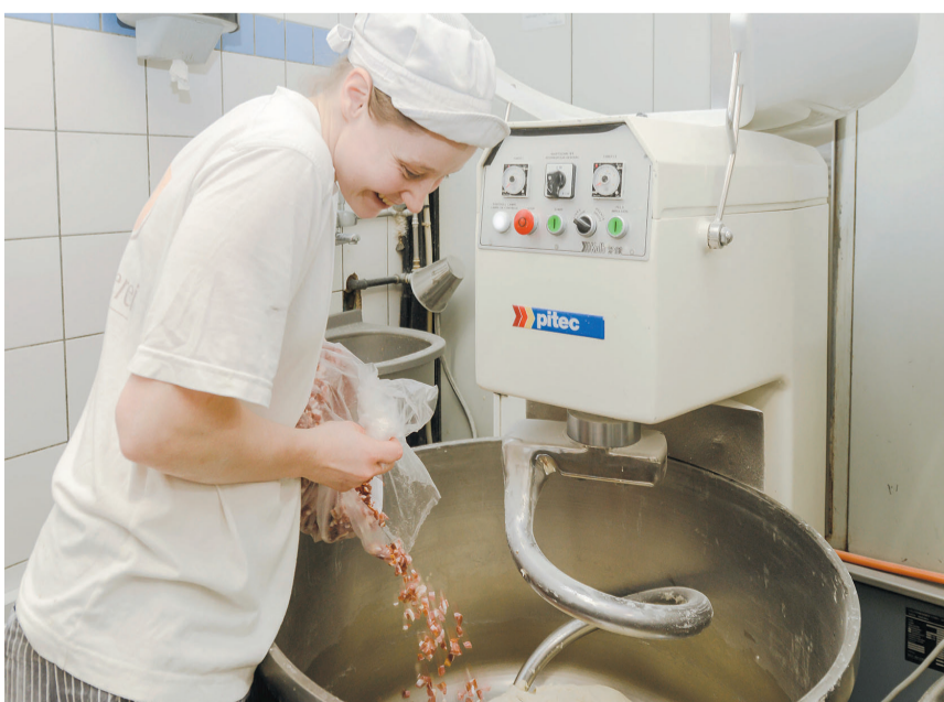
Für die salzige Variante werden dem Teig Speckwürfel hinzugefügt.