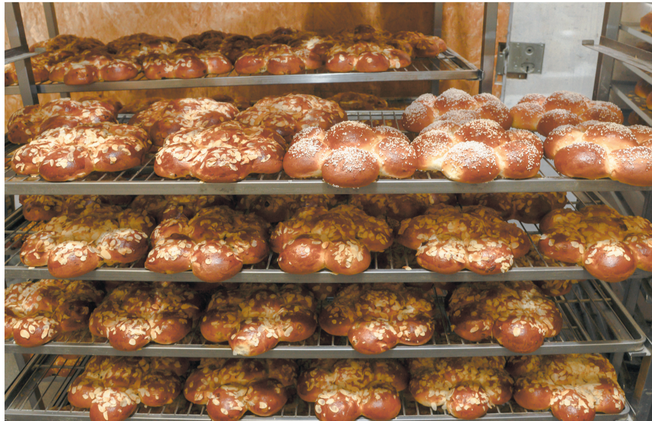
Die Dreikönigskuchen aus Stuckis Backstube sind sehr beliebt.