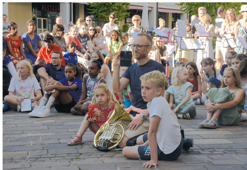
Beim Open Air in Urtenen-Schönbühl waren die Zuschauer-Ränge voll.