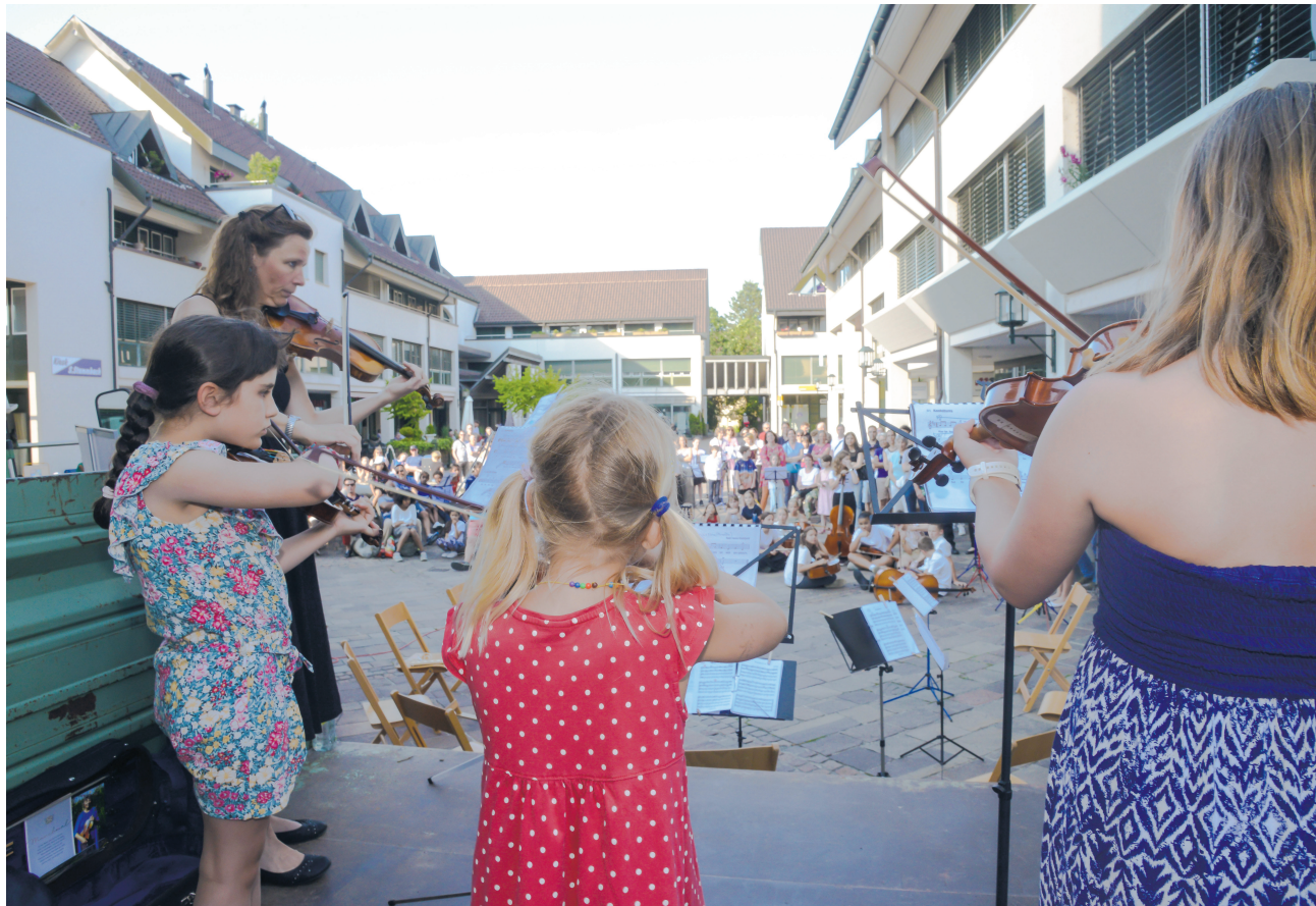
Ein Anhänger als Bühne: Die Musikschule Region Jegenstorf war mit Traktor und Wagen unterwegs und spielte eine Woche lang in den Gemeinden der Region.

Auflageort und Einsprachestelle Bauverwaltung, Bernstrasse 13, 3303 Jegenstorf