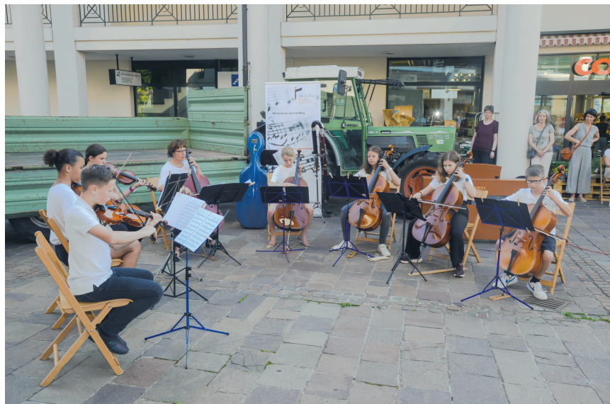
Eine der beiden Streicherformationen im Einsatz.

Mit Traktor und Wagen spielten Schülerinnen und Schüler der Musikschule Region Jegenstorf erstmals an Open-Air-Konzerten in den Gemeinden des Einzugsgebietes.