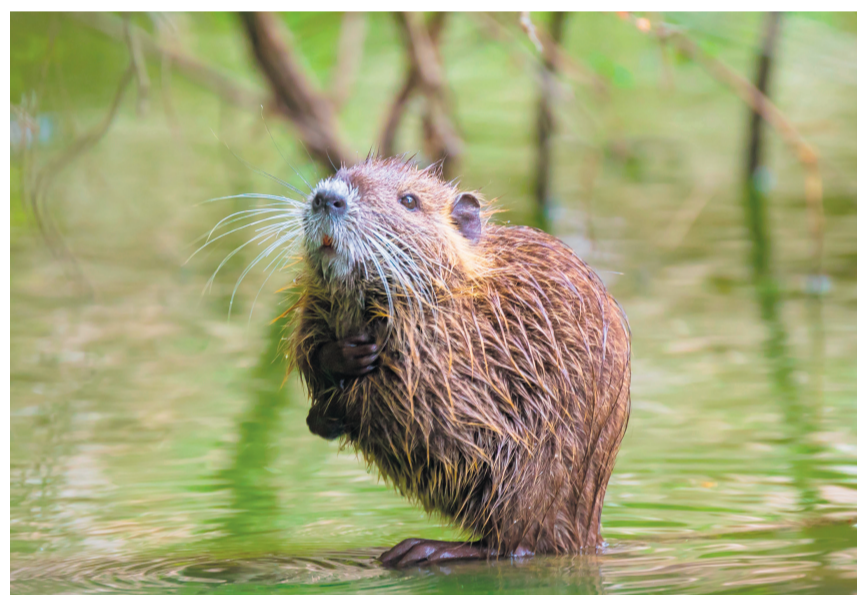
Die Bisamratte, schon seit den 1930er-Jahren in der Schweiz.