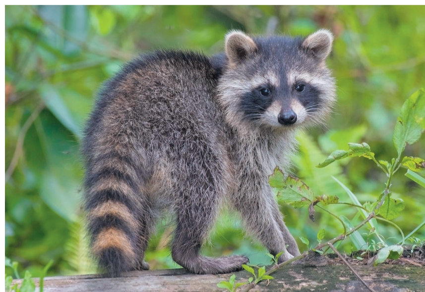
Ein junger Waschbär fühlt sich wohl in der Schweiz.

Der Goldschakal, ein mittelgrosser Vertreter der Hundartigen, ist eine weitere Art auf dem Vormarsch in Europa. Etabliert ist der Goldschakal in Griechenland und im Balkan. Erste gesicherte Beobachtungen aus der Schweiz stammen aus dem Jahre 2011. Seither wird er selten, aber regelmässig nachgewiesen. Es handelt sich um eine sehr anpassungsfähige Art mit entsprechend grossem Besiedlungspotential.