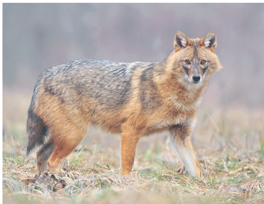
Der Goldschakal ist sehr anpassungsfähig und hat deshalb ein grosses Besiedlungspotential.

Neophyten, also invasive Pflanzen, die hierzulande nicht heimisch sind, sind vielen Leuten ein Begriff. Weit weniger bekannt sind die Neozoen: fremdländische Säugetiere, die sich hier mittlerweile heimisch fühlen. Zu ihnen gehören die Bisamratte, die Nutria, der Waschbär, der Marderhund oder der Goldschakal.