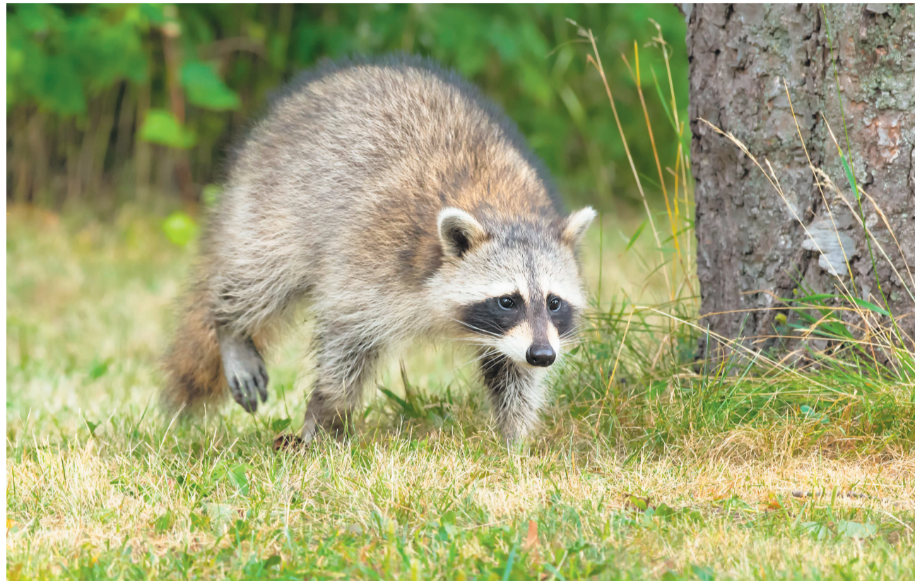
Der Waschbär ist ein seltener Gast, fühlt sich aber doch schon heimisch.

Amt für Wald und Naturgefahren Gemeinde Münchenbuchsee