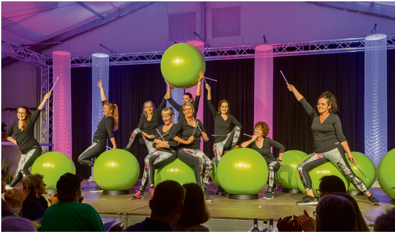
Alt und Jung trafen sich am Jegenstorfer Dorffest. Der TV Jegenstorf begeisterte das Publikum und trug mit seiner Tanzshow zu einem abwechslungsreichen Programm bei.

die Vorgeschlagene durch den Kirchgemeinderat in stiller Wahl als gewählt erklärt (OgR, Art. 86).