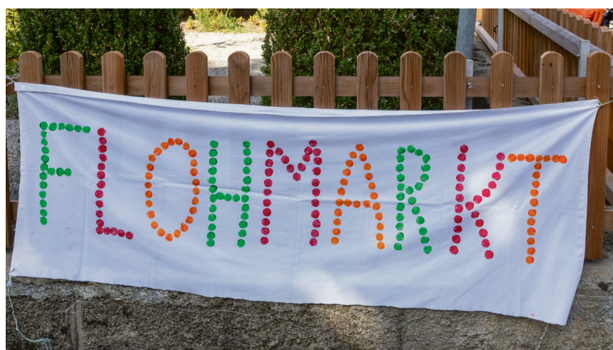
Am Flohmarkt konnte der eine oder andere in Nostalgie schwelgen.