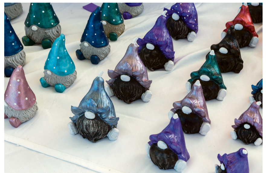
Der beliebte Dorfmärit war geprägt von viel Handwerk aus der Region.