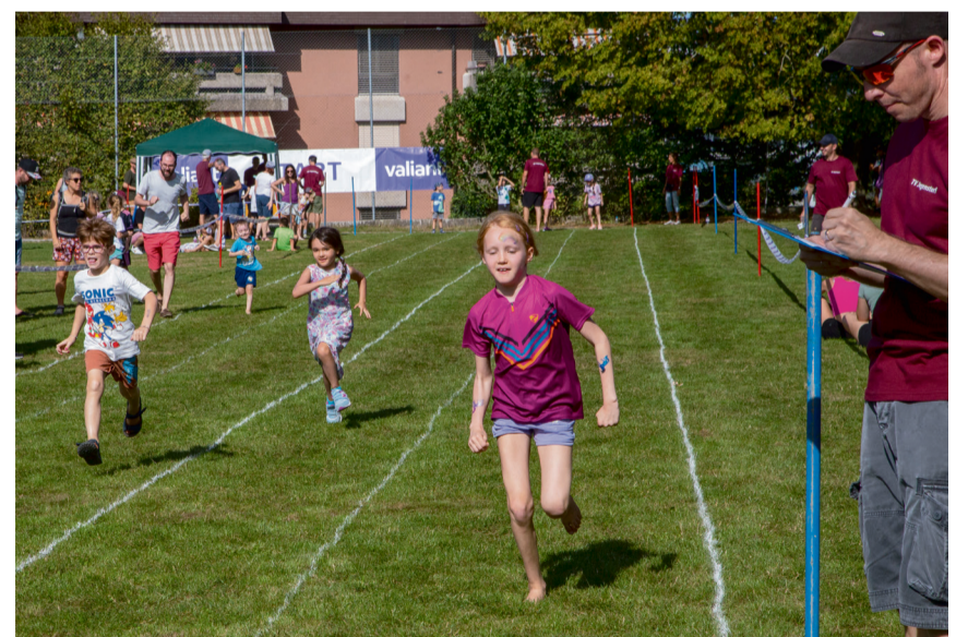
Eines der Highlights war der Sprintwettkampf «Schnällscht Jegenstorfer 2023».