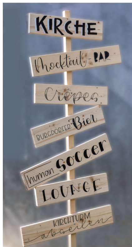
Zahlreiche Aktivitäten und ein vielseitiges Ess- und Getränkeangebot am Dorffest.