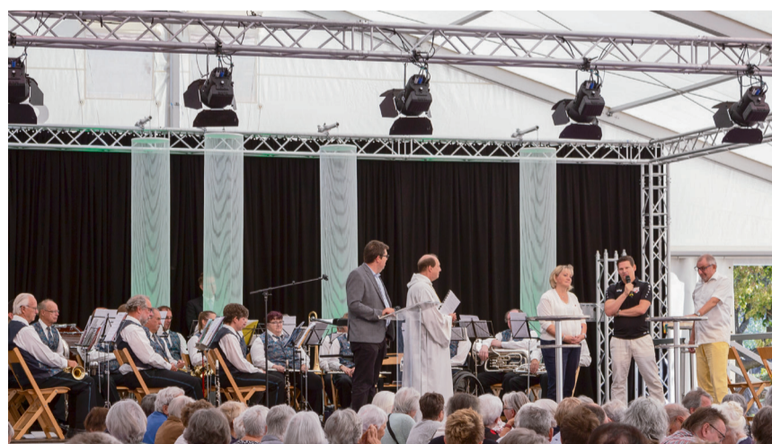
Am Sonntag fand ein Ökumenischer Frühschoppen-Gottesdienst mit interessanten Interview-Gästen aus Jegenstorf statt.