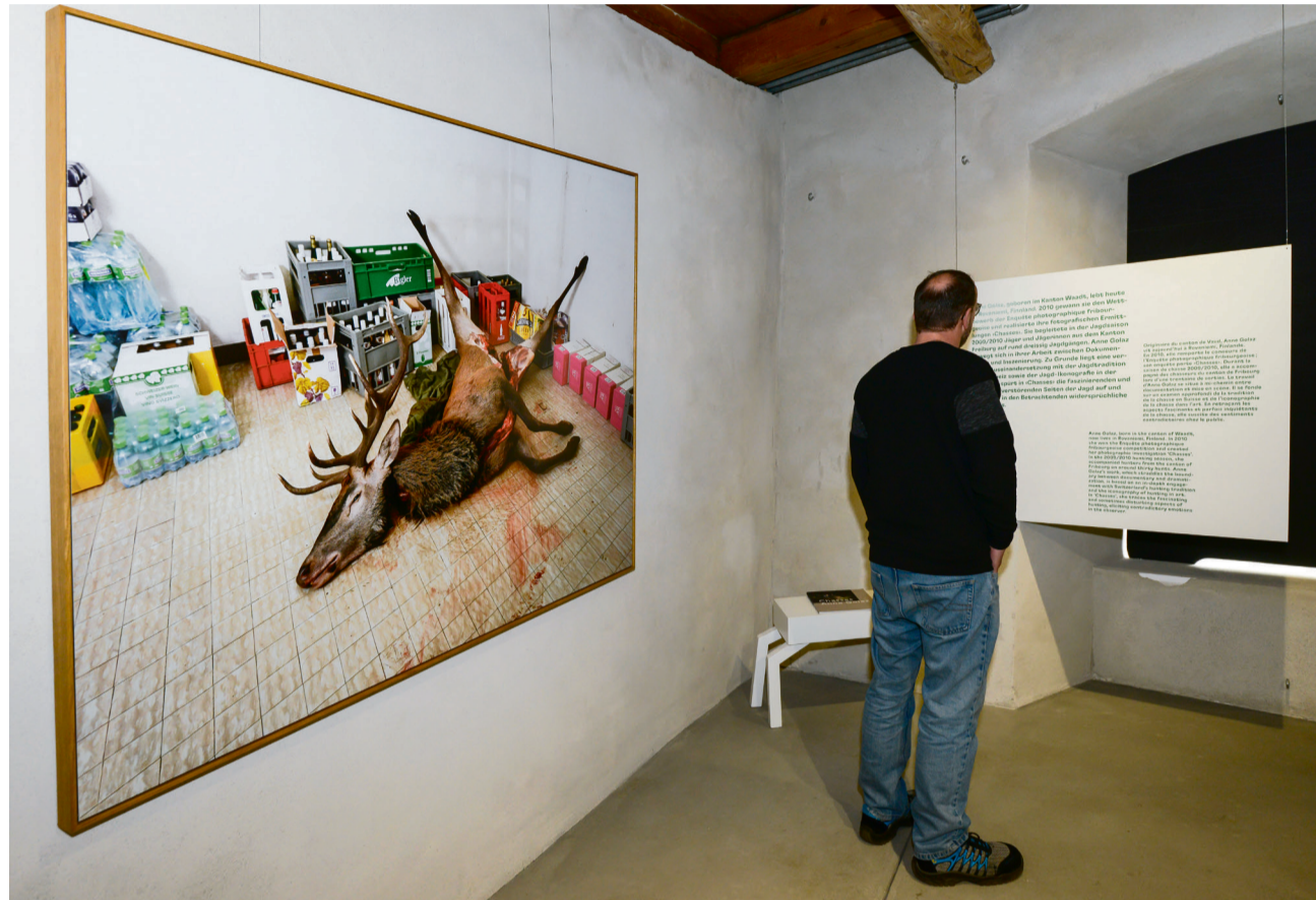
Das Jagen ist das eine, das Verarbeiten des Fleisches eine ganze andere Sache.