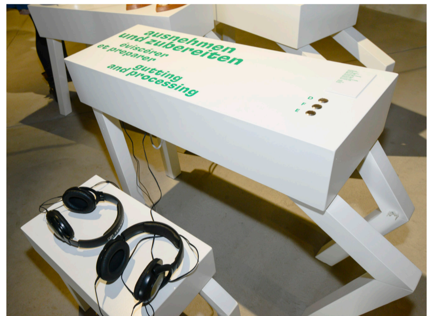
Eine stille Ausstellung. Die Besucher hören vor allem den Jägern zu.