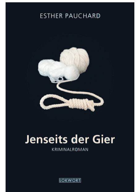
Die Krimiautorin stellte ihren neueste Kriminalgeschichte «Jenseits der Gier» vor.