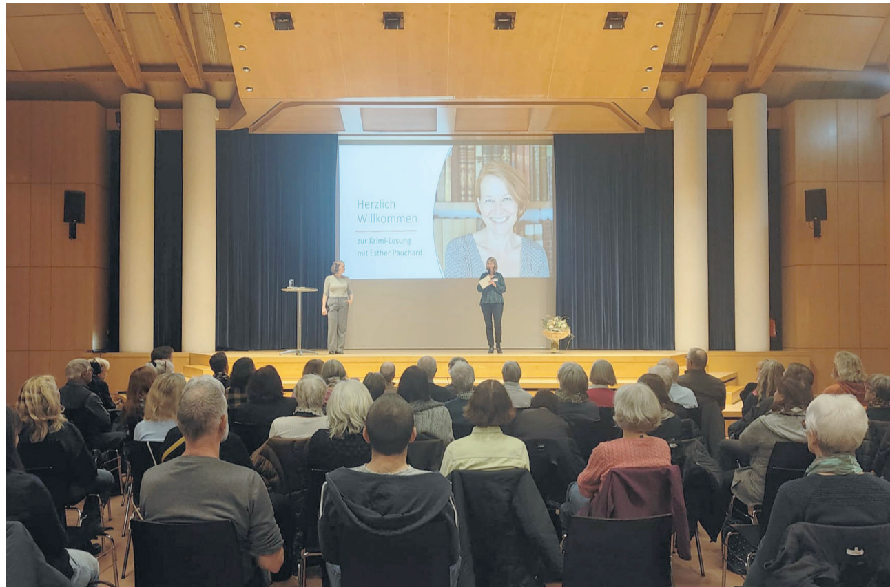
Was lange währt wird endlich gut. Beim dritten Anlauf hat eine spannende Lesung des neuesten Buchs «Jenseits der Gier» der Krimiautorin Esther Pauchard im Zentrumsaal von Schönbühl stattfinden können.

zeiten auf. Die Unterlagen können zusätzlich auf eBau eingesehen werden. https://www.portal.ebau.apps.be.ch/public-instances?municipality=20588