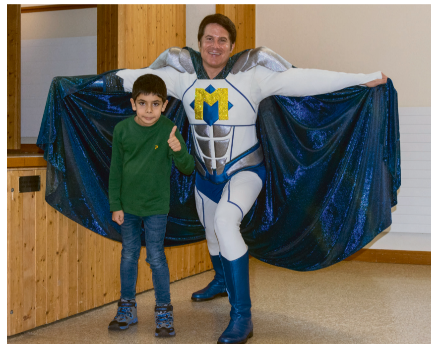
Fotosession mit dem Superhelden Bionicman. Die Kinder sind begeistert.

Text: Karin Balmer