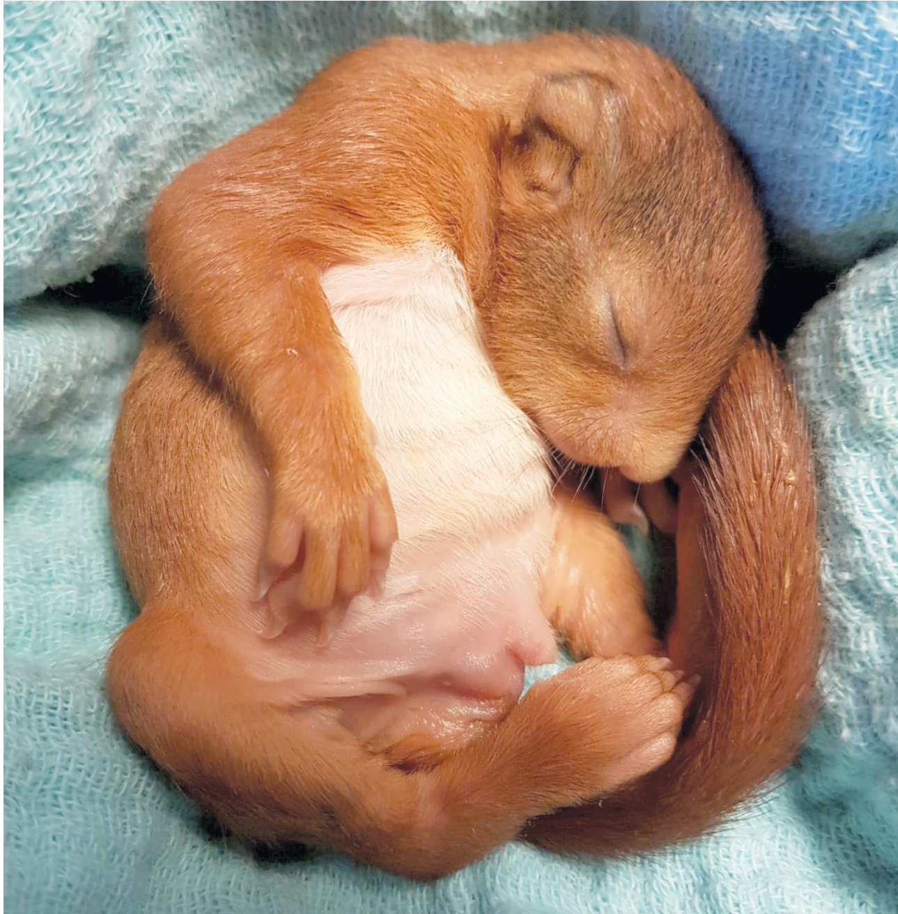
Ein Eichhörnchen, das aus dem Nest gefallen ist, wurde zur Eichhörnchennotfallstation gebracht und dort gepflegt.

Das Europäische Eichhörnchen ist eine Gattung aus der Familie der Hörnchen und gehört zu den bekanntesten Säugtieren in Europa. Es ist in ganz Europa und Asien verbreitet und auch in der Schweiz beheimatet. Das Eichhörnchen ist ein kleines, wendiges Nagetier mit grossen Augen und einem buschigen Schwanz, das hauptsächlich in Wäldern und Parks zu finden ist. Die neugierigen Tiere können auch ziemlich zutraulich sein, wenn sie an den Menschen gewöhnt sind.