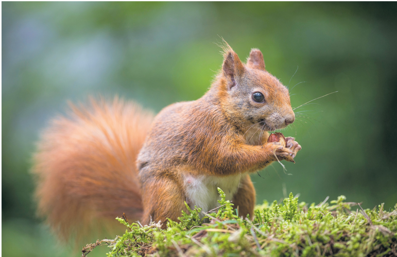
Das Europäische Eichhörnchen mit seinen grossen Augen und seinem buschigen Schwanz, stellt sich vor. Das kleine, putzige Nagetier ist ein wendiger Kletterer.