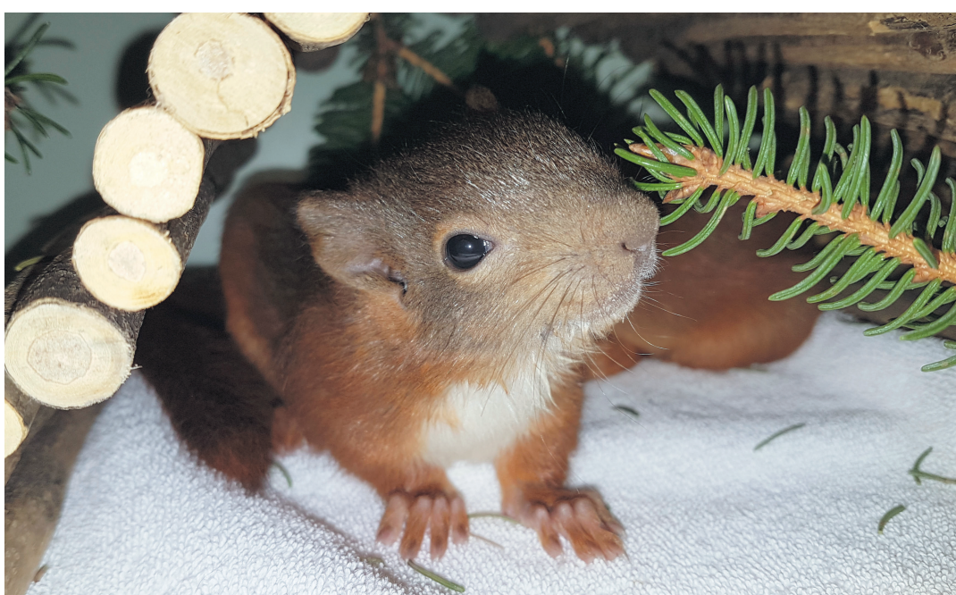
Sobald das verletzte Eichhörnchen auf der Auffangstation wieder gesund ist, wird es wieder ausgewildert.