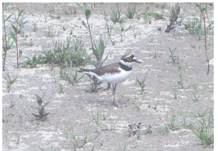
Ein Flussregenpfeifer auf einer Kiesbank an der Emme