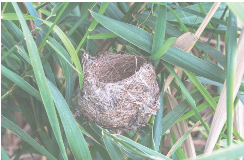
Das Nest eines Teichrohrsängers am Moossee

Der Ranger arbeitet für und mit der Natur. Er nimmt die Vermittlerrolle zwischen Natur und Mensch ein. Seine Aufgaben sind sehr vielseitig und je nach Gebiet unterschiedlich. Eine der Hauptaufgaben ist die Sensibilisierung