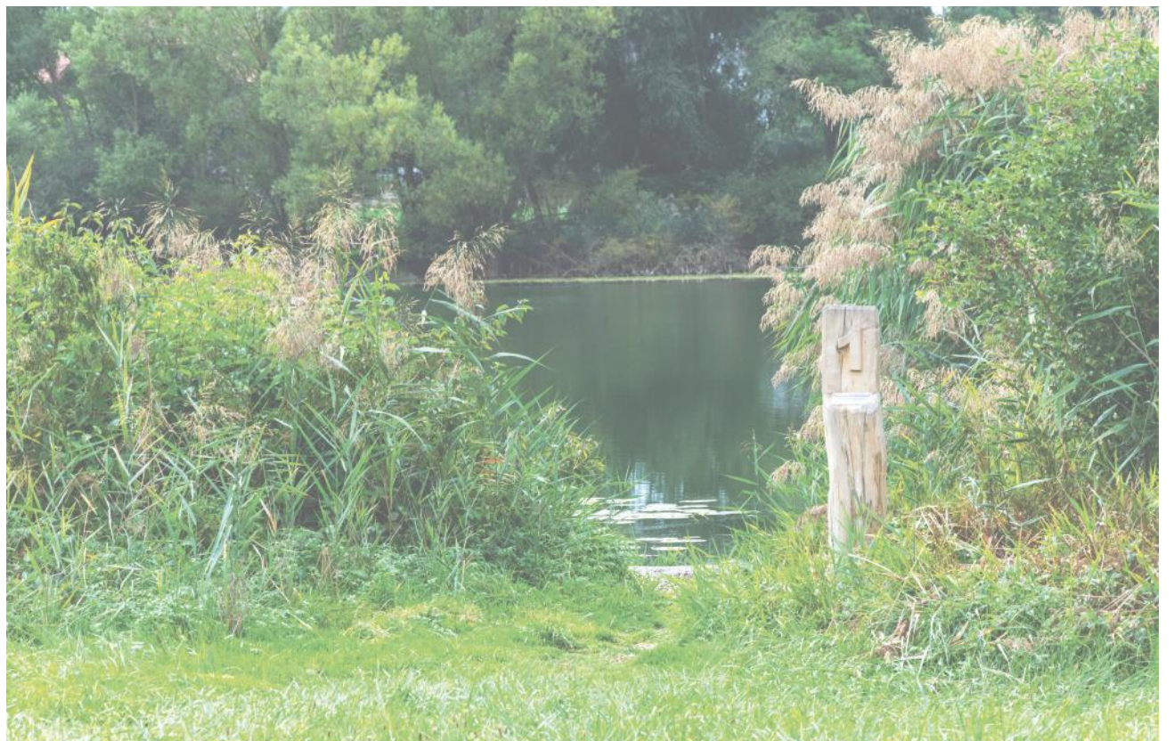
Einer der 13 Fischplätze am Moossee, die für die Fischer reserviert sind.