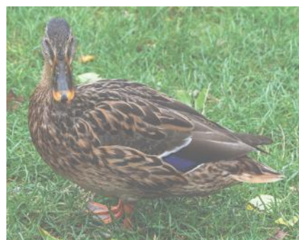
Eine Stockente am Moossee

Text: Karin Balmer