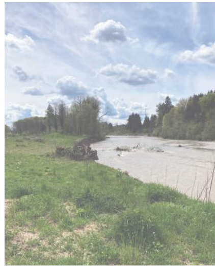
Renaturiertes Augebiet an der Emme bei Utzenstorf und Bätterkinden.

Iris Baumgartner aus Ersigen ist heute zuständig für die Naturschutzgebiete am Moossee, an der Emme im Oberburgerschachen, dem Ämmeschachen-Urtenensumpf bei Utzenstorf und Bätterkinden sowie bei der Emme in Biberist und Luterbach. Im Ämmeschachen ist die Rangerin zuständig für die Koordination und Mithilfe bei der Neophytenbekämpfung. Bei Biberist ist sie