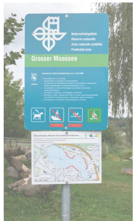
Auf der Tafel beim Moossee steht, welche Regeln zum Schutz der Tiere und Pflanzen zu befolgen sind.