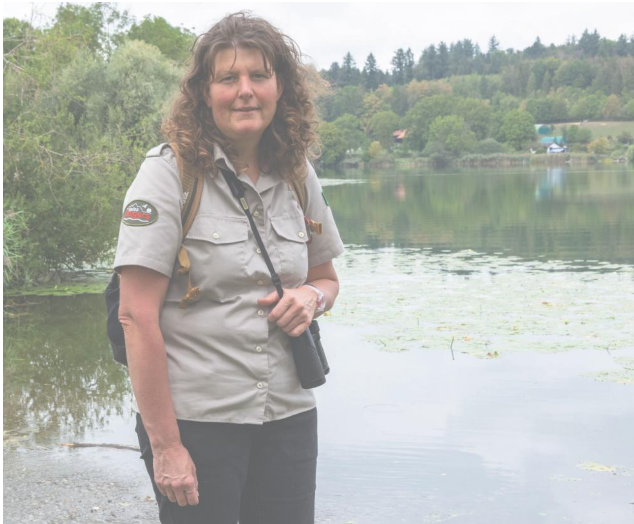
Die Rangerin sorgt in verschiedenen, Naturschutzgebieten in der Region wie zum Beispiel am Moossee dafür, dass die jeweiligen Vorschriften von den Besuchenden befolgt und respektiert werden.