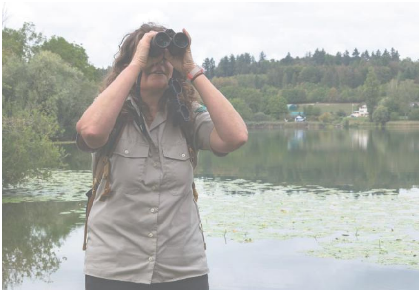
Die Rangerin beobachtet die Tiere und freut sich, auch mal eine seltenere Vogelart zu entdecken.

während der Brutzeit von den Flussregenpfeifern für die Besucherlenkung und die Sensibilisierung tätig.