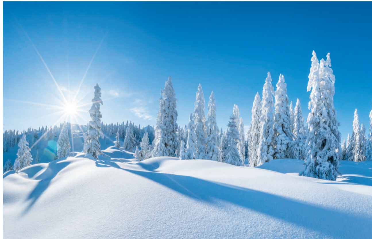
Zum neuen Jahr schauen die Verantwortlichen des Fraubrunner Anzeigers auf das vergangene Jahr zurück und machen einen Ausblick auf das neue Jahr. Blickpunkt Seite 5.