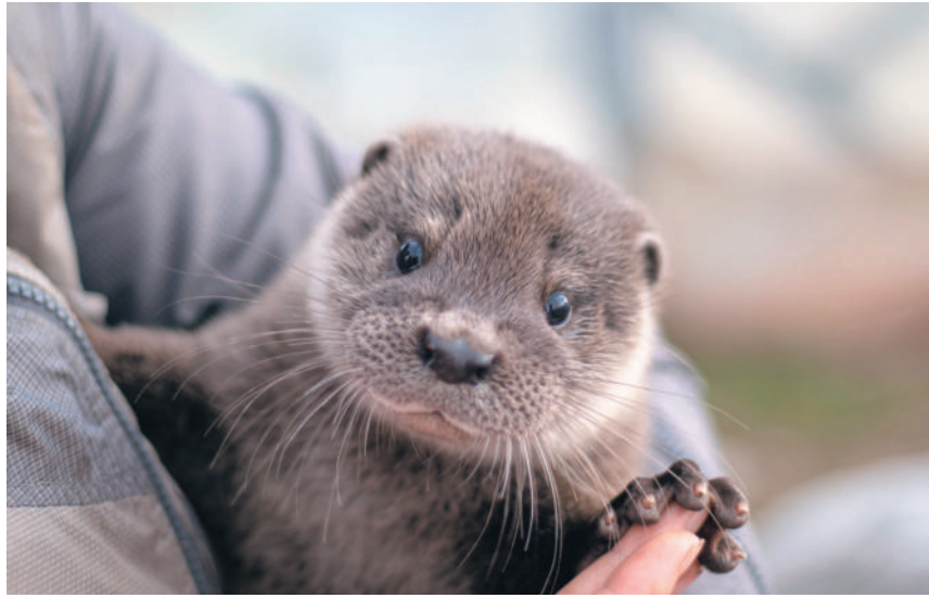
Die jungen Fischotter werden nach einem Jahr von der Mutter aus dem Revier vertrieben.

Der in Mitteleuropa, und somit auch in der Schweiz, lange Zeit abwesende Fischotter kehrt zurück. Fischotter gehören zu den Marderartigen, zu welchen in der Schweiz weiter noch die Unterfamilie Marder und Dachs zählen. Es gibt bei uns 5 Arten, die zu der Familie der Marder gehören: Mauswiesel, Hermelin (Wiesel), Steinmarder, Baumwiesel und Iltis. Der Nerz ist in der Schweiz ausgestorben. Erfahren Sie mehr über die Rückkehr des Fischotters.