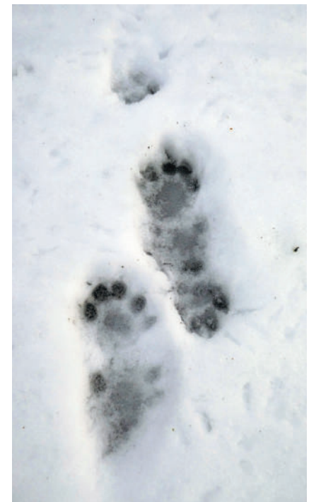
Anhand von seinen Spuren kann der Fischotter lokalisiert werden.