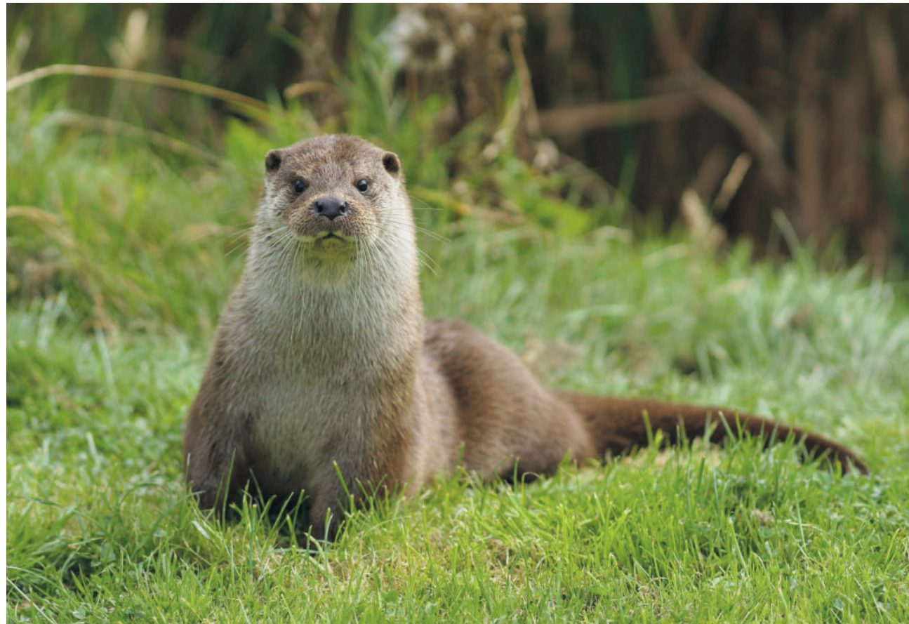
Der in Mitteleuropa, und somit auch in der Schweiz, lange Zeit abwesende Fischotter kehrt zurück. Erfahren Sie mehr über das zu der Familie der Marder gehörende Säugetier. Blickpunkt Seite 5.